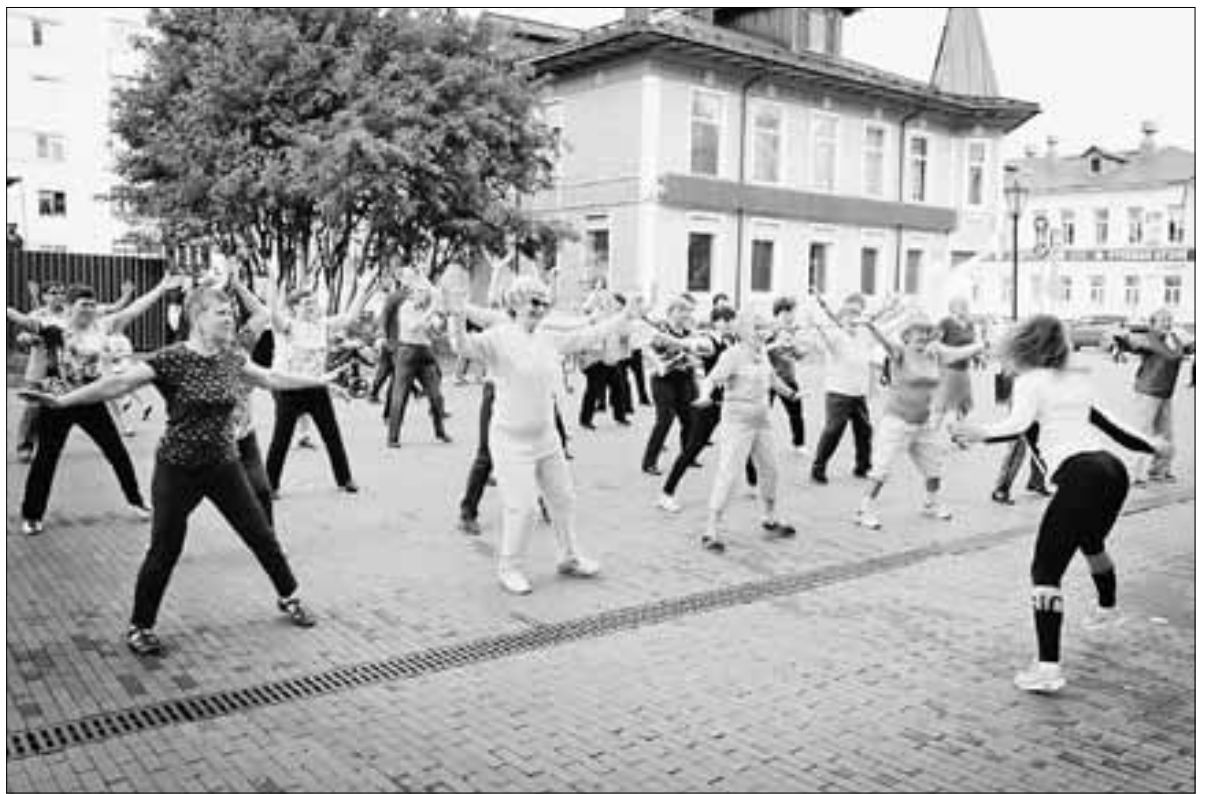
■ Летние танцевальные занятия для людей старшего возраста – удачный проект «Студии хорошего самочувствия».

– Обращаем внимание в первую очередь на снижение массы тела