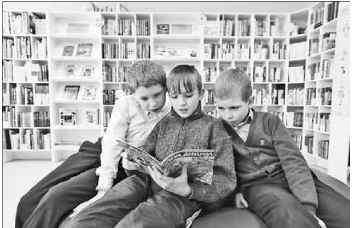
■ В библиотеках очень ждут, когда посетители смогут к ним вернуться.

Исакогорская библиотека № 12 провела онлайн-акцию «Мое советское детство». Это воспоминание о том, какой интересной была жизнь советского ребенка и школьника. В какие игры играли дети того периода? Как первоклашек отправляли в школу и во что одевали детей того времени? Для взрослых эта тема – путешествие в прошлое. Для молодежи – возможность узнать о том, как учились, как проводили свободное время, чем увлекались их дедушки и бабушки, мамы и папы, когда не было компьютера и интернета, когда самым увлекательным занятием было «поиграть во дворе». Общее количество просмотров составило более 23 тысяч человек, увеличилось число новых участников группы «Исакогорская библиотека № 12». Проект пользовался чрезвычайным успехом! Люди открывали свои старые альбомы, делились фотографиями, воспоминаниями, многие возобновили обще-