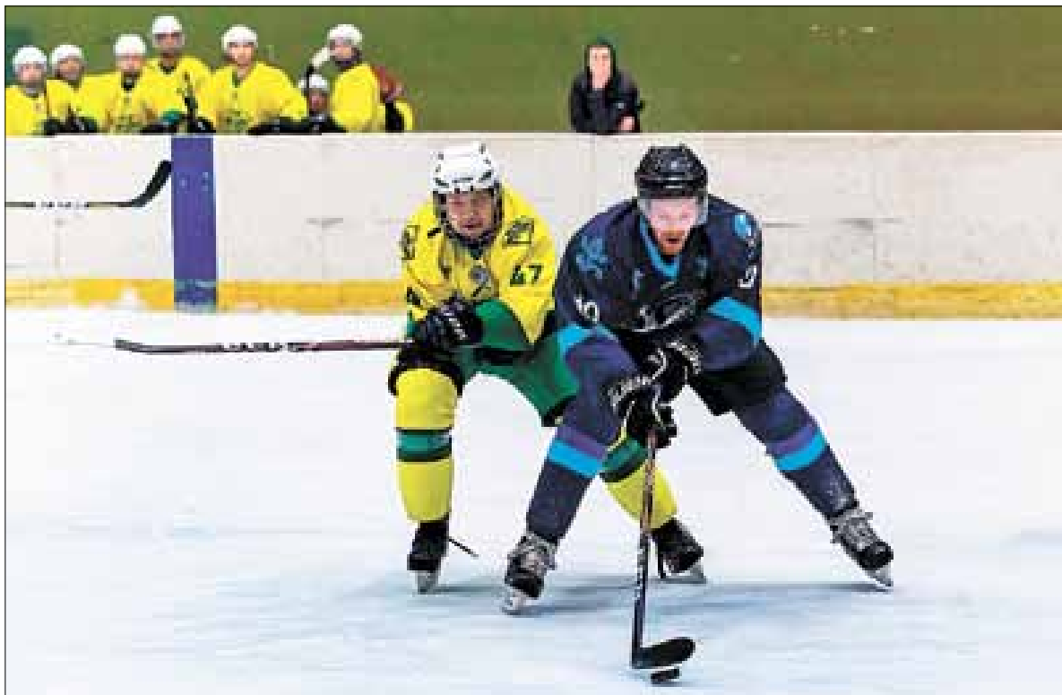
■ Финал «Лиги Надежды»: «Ледокол» – «УЛК».

– Все, конечно, очень расстроены. Позади тяжелейший марафон длиной почти в шесть месяцев из региональных отборочных соревнований. Победители за исключением дивизиона «Лига Надежды» были определены. Практически у всех уже были куплены билеты. Многие собирались ехать на финал вместе с семьями. Были надежды, что финал IX Всероссийского фестиваля Ночной хоккейной лиги в Сочи будет сдвинут на другие, более поздние сроки. К сожалению, после пресс-конференции исполни-