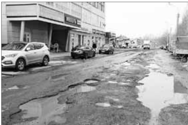
■ Учительскую приведут в порядок от ул. Шабалина до ул. Урицкого.