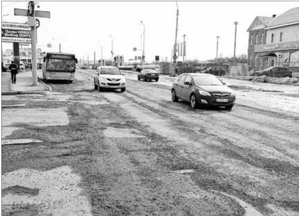
■ Московский проспект отремонтируют от ул. Павла Усова до ул. Галушина.

«Общая сумма финансирования контрактов по нацпроекту «Безопасные и качественные автомобильные дороги» составит 490 миллионов рублей»