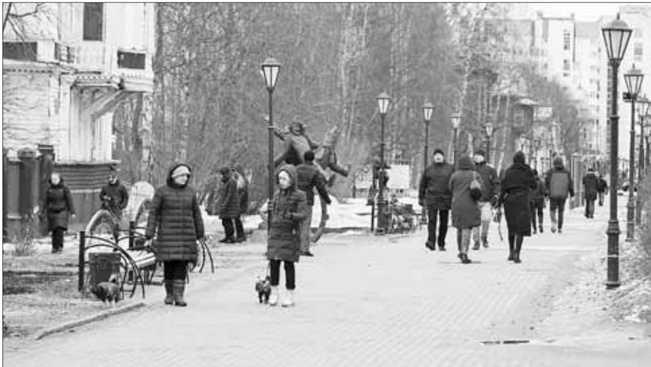
■ Несмотря на объявленную самоизоляцию, в понедельник на Чумбаровке было многолюдно.