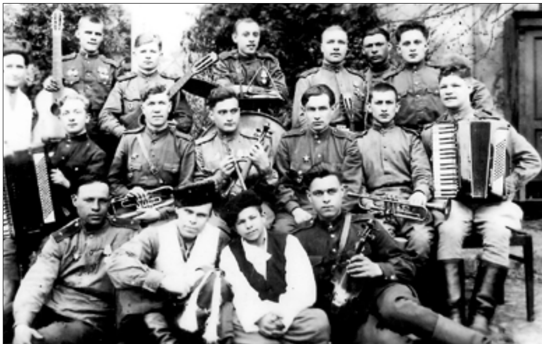
■ Тот самый снимок джаз-оркестра